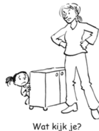
Wat kijk je?

In het begin was alles goed. Maar in de verhalen van deze week ontdekken we dat er ook altijd dingen zijn die minder goed zijn. Adam en Eva kruipen weg in de struiken omdat ze zich schamen voor God, Kaïn weet niet waar hij kijken moet als God vraagt waar zijn broer is. Als iemand je beschuldigend aankijkt, kun je wel wegkruipen – Wat kijk je?