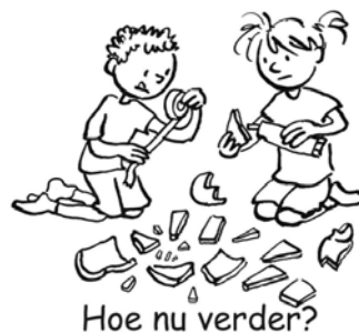
Hoe nu verder?