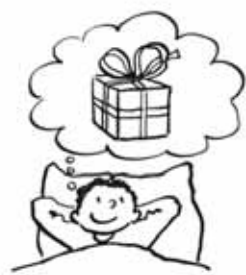
Ik ben niet zeker

God heeft beloofd dat Abraham en Sara een kind zullen krijgen. Maar het duurt lang voordat dat gebeurt. Abraham en Sara worden onzeker. Ze bedenken zelf een plan om een kind te krijgen. Bij dit verhaal praten we over zeker zijn / geduldig afwachten en zelf actie ondernemen.