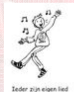
Ieder zijn eigen lied

Maria ontmoet Elisabet, Lucas 1:39-45 De geboorte van Johannes, Lucas 1:57-66